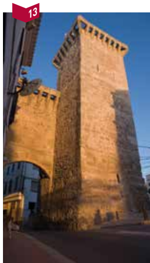
Pont de Sant Roc

XXe siècle. Construite dans les années 1950, selon les plans de l'architecte Josep Claret, en remplacement des anciennes rampes de la marine, il s'agit d'une allée sinueuse reliant la ville au port. Elle est bordée par les jardins du parc Rochina, où le monument Creu de sant Pere rappelle l'existence de l'ancien ermitage de la corporation des pêcheurs, dédié au saint. L'esplanade finale du parc est ornée de figures de fer stylisées du sculpteur Gaspar Servera.